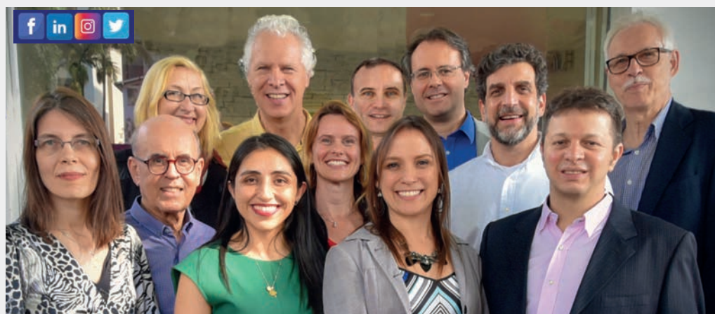
PROFESSORES INTERNACIONAIS PSICANALISTAS OU PSICO-SÓCIO-TERAPEUTAS

Cursos Livres de Idiomas e de Pós-Graduação em Inglês, Português