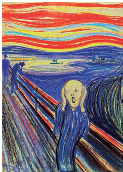
O Grito de Munch

Pacheco: Um exemplo é a área da medicina: médicos, psiquiatras, psicólogos, todos eles veem os problemas vindos de sintomas físicos do corpo ou da sociedade em geral. Eles não veem o problema principal, que tem origem em nossa vida