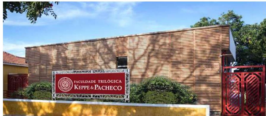
Sede da Faculdade Trilógica Keppe & Pacheco em Cambuquira

Este curso, que será realizado em São Paulo, nas modalidades Lato Sensu e Livre, tem como objetivo a apresentação de inovação tecnológica aplicada a produtos com eficiên-