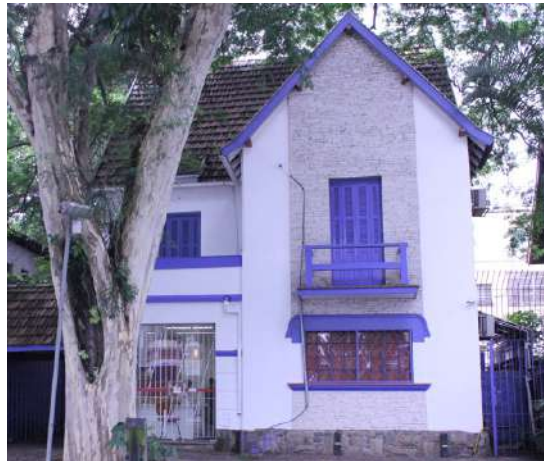
Local do curso: Casa da STOP, Av. Rebouças 3115,