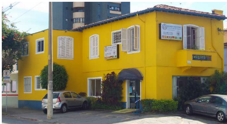
Unidade Moema do Trilogy Institute

A razão para esses bons resultados é simples: quando a pessoa se acalma e fica mais tolerante