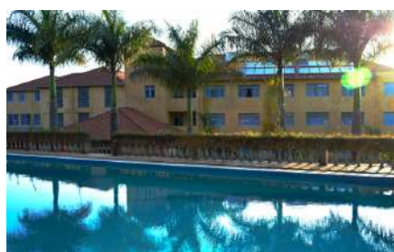
Grande Hotel Trilogia - Cambuquira - MG

A metodologia aplicada nas atividades terapêuticas do hotel segue a base científica da Trilogia Analítica, desenvolvida pelo psicanalista, cientista e filósofo Norberto Keppe, que há mais de 50 anos trabalha no desenvolvimento e aplicação desta ciência.