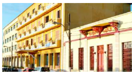
Frente do GHT decorada com azulejos portugueses

Informações e reservas: (11) 98449-7618 | (35) 3251-1422 www.grandehoteltrilogia.org.br reservas@grandehoteltrilogia.org.br