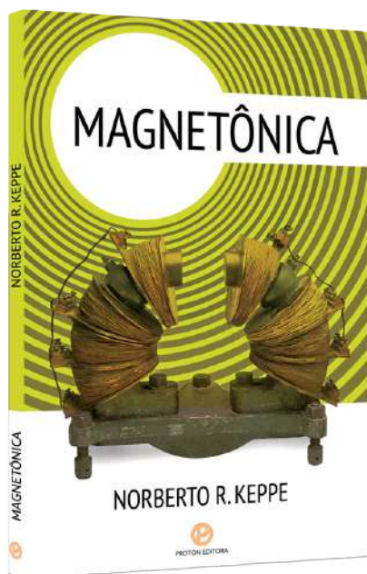
Norberto R. Keppe* Extrato do livro Magnetônica , pág. 15

Estamos na época da maior evolução na humanidade, passando da conduta movicêntrica para a internocêntrica – com certa semelhança ao século XVII, quando Copérnico e Galileu demonstraram que a Terra é que girava em torno do Sol (na teoria heliocêntrica), ao contrário do pensamento que a Terra seria o centro.