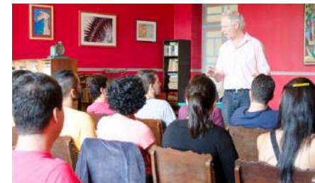
No Trilogy, ao mesmo tempo que o aluno aprende de outra língua, ele começa a se conhecer melhor.