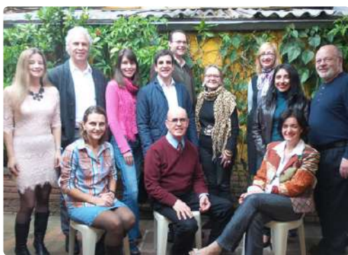
A equipe de professores do Trilogy Institute é formada por europeus, americanos e brasileiros com larga experiência no exterior, treinados no método keppeano de ensino.

As emoções, os pensamentos, todos estes aspectos essenciais da vida do